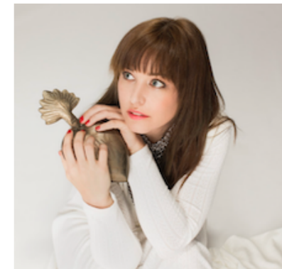
Natasha st Pier